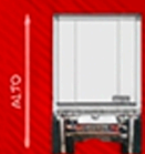
ALTO: 4.15 m.